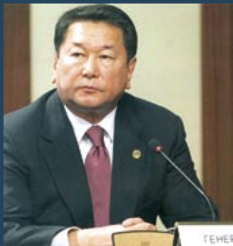
上合组织的秘书长博拉特·努尔加利耶夫

上合组织框架内所采取的行动都体现出国之间团结一致的精神。可以说，过去的一年在上海合作组织区域发生了一系列危机局势，或者是非常严重的自然灾害。比如去年冬天塔吉克斯坦境内遭遇严冬自然灾害，并且乌兹别克斯坦、吉尔吉斯斯坦地区也曾经发生了雪灾。中国的西藏自治区也发生了一些骚乱的情况。后来，在四川又发生了前所未有的地震灾害。在所有危机和灾害的面前，上海合作组织6个成员国都能够保持团结一致，来共