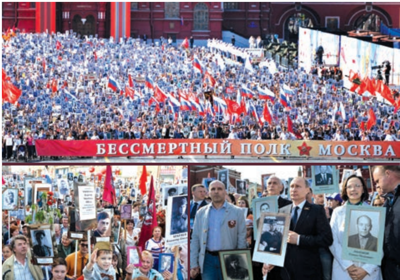
Молчаливо и торжественно, как река, текут они по городам России (а теперь уже и других стран) в сакральные дни военных дат. Дети, внуки, правнуки погибших солдат войны проносят над головами портреты своих погибших близких, и это - будто их явление из небытия, суровый сигнал для тех, кто «точит зубы» на Россию.

Тезис «фашисты внезапно напали» - неточен. Войну ждали, к ней готовились, понимая, что заключенный в августе 1939 года пакт о ненападении между СССР и Германией не остановит Гитлера. Руководство страны всеми силами пыталось оттянуть начало смертельной схватки, выиграть время - обороноспособность была уязвима, армия только начала процесс перевооружения. Но... черный день 22 июня настал. В половине четвертого утра немецко-фашистские войска и их союзники получили условный сигнал «Дортмунд», и по советским