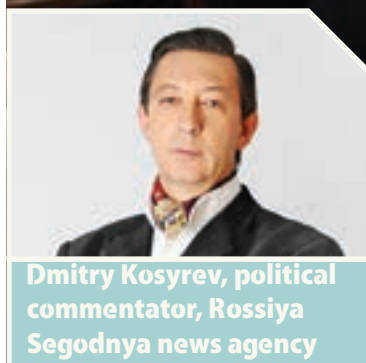
Dmitry Kosyrev, political commentator, Rossiya Segodnya news agency

印度和巴基斯坦这两个南亚国家加入上海合作组织，引起了合理的反应：现在又会怎么样？会发生什么样的变化，或者，可预料什么样的举措，包括经济、人文、政治方面的，什么时候它们将被列入文件里，什么时候又会得到实施？